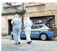
La scientifica in via Cascino

Anziché scorrere la lista e guardare uno per uno gli avvisi di vendita, attraverso il sistema di geolocalizzazione dei dispositivi mobili, l'app di Astalegale.net permetterà agli utenti interessati di effettuare, a partire dalla posizione in cui si trovano, ricerche mirate e chirurgiche degli immobili oggetto di vendita giudiziaria. L'app non sostituisce il sito internet istituzionale del Tribunale di Gorizia - dal quale