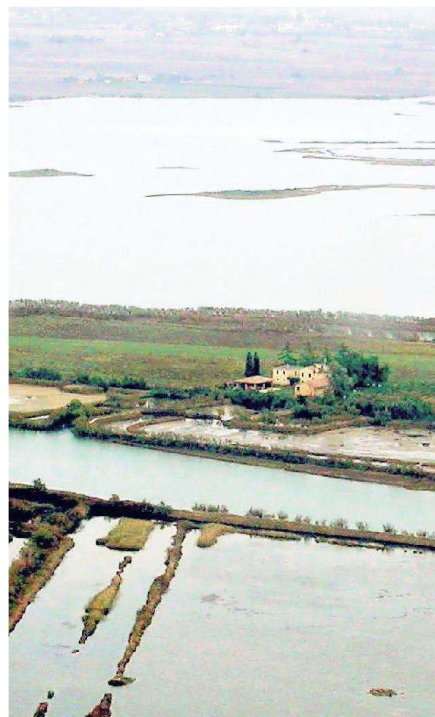
Uno scorcio dell'isola di San Giuliano nella laguna di Grado

L'eccezionalità comunque è data dai terreni agricoli, sedimentati nei secoli, a cui si aggiungono due distinte valli da pesca, l'una più piccola posta a levante, l'altra di maggiori dimensioni, posta a ponente. Il